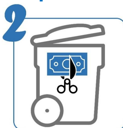
Réduction de la taxe sur les déchets