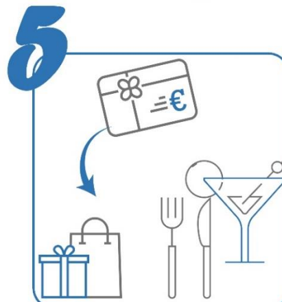
Actions pour encourager à consommer "local"