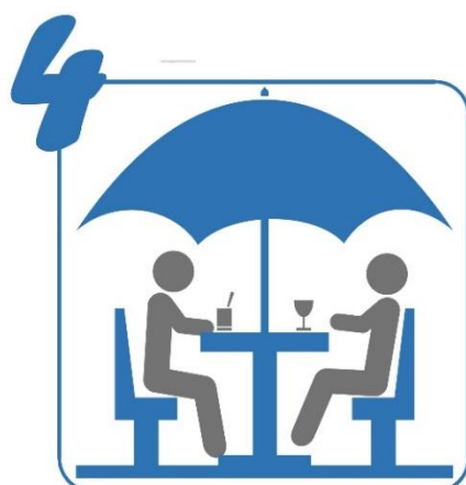
Prime Horeca pour les terrasses